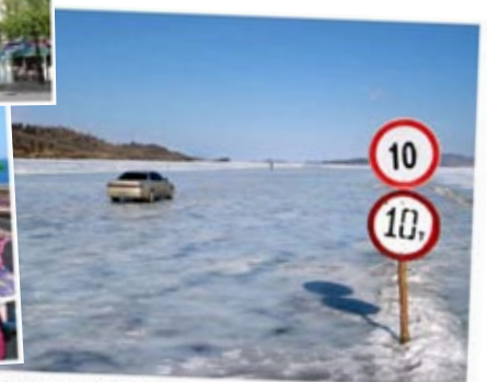
The ice highway running to Olkhon Island. This road is set up by the government each winter when Baikal freezes, they check the ice thickness and post weight limits each day. There are several ice highways running across Baikal, the longest is over 800km.